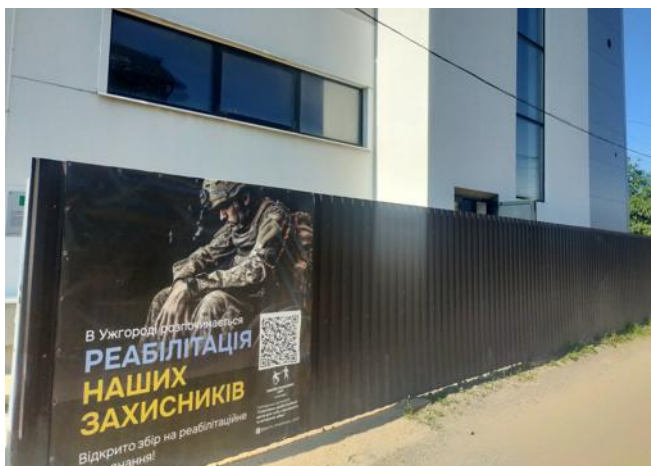
Le centre d'Oujhorod accueille de nombreux soldats blessés pour leur rééducation et pour leur apporter un soutien psychologique.

C'est ainsi que dans un grand hall un peu vide du rez-de-chaussée, trône une table de ping-pong. Dans l'allée de gauche, les collectes de matériel médical venu de l'étranger sont rangées. Dans l'allée de droite, du matériel de gym et des appareils de fitness flambant neufs attendent leurs utilisateurs. Ce sont 35 machines offertes par l'Irlande en janvier de cette année. « Alors qu'ils sont une centaine en rééducation, nous en