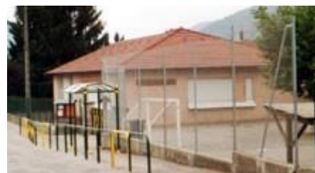
Site du Bérard