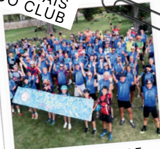
CYCLO CLUB DE COUBLEVIE