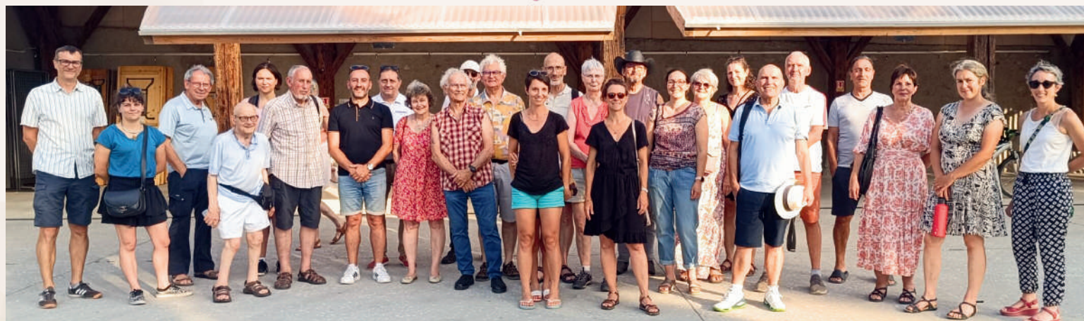
PHOTO DE FAMILLE DE LA VIE ASSOCIATIVE 2025

Comité Jeunesse Voisins enfance Partage Petite Artistique Alliance Amicale Communauté Entraide Valeurs associative vie Amis Club Action Coulevie Fédération Envies Harmonie Engagement Bénévoles Lien Association Sport Citoyen Culture vivre