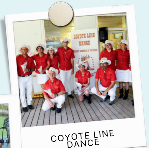
COYOTE LINE DANCE

Contact : Bheemuck Rakesh 04 76 70 04 86 tennis.cv@free.fr