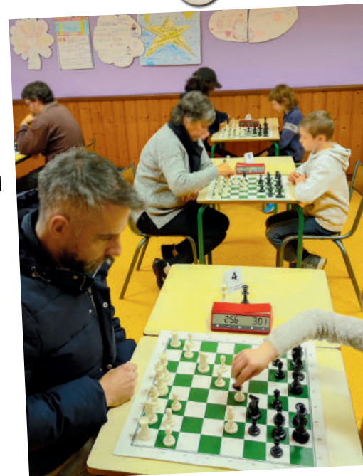
LA TOUR DE CHARTREUSE