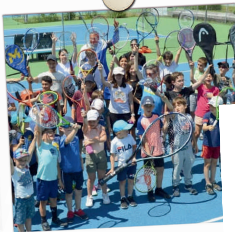
TENNIS CLUB DE COUBLEVIE VOIRON