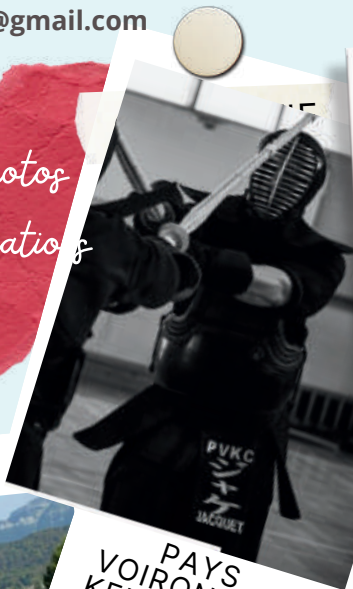
PAYS VOIRONNAIS KENDO CLUB