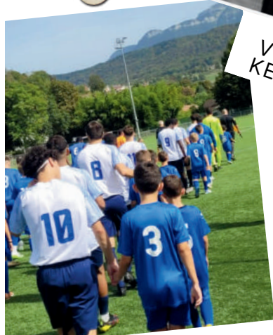
FOOTBALL CLUB DE LA SURE