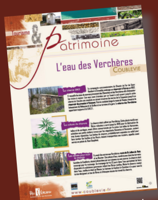
Exemple de panneau du patrimoine - Les Verchères