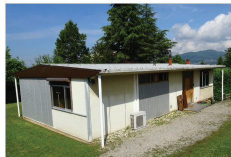
Maison en structure aluminium

Le plus petit des trois lotissements, construit un peu à l'écart au dessus de l'EHPAD actuel, il ne comporte que cinq lots destinés plutôt à des employés. Maisons identiques en structure aluminium, avec trois