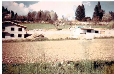
Champ agricole sous le lotissement

Au dessus du lotissement, un grand champ où pâturaient des vaches et en dessous des champs de maïs.