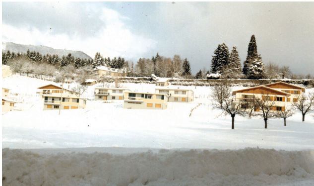
Lotissement Maleyssard sous la neige dans les années 60 - 70

Dans les années 60 ou 70 le climat était plus rude que maintenant. Il neigeait régulièrement à Noël et la neige persistait souvent sur la route et dans les terrains durant un mois. On démontait provisoirement la clôture qui séparait le lotissement et le pré au dessus, les enfants faisaient de belles descentes en luge depuis le haut du coteau. Quelques parents entretenaient même une boucle de ski de fond dans le champ.