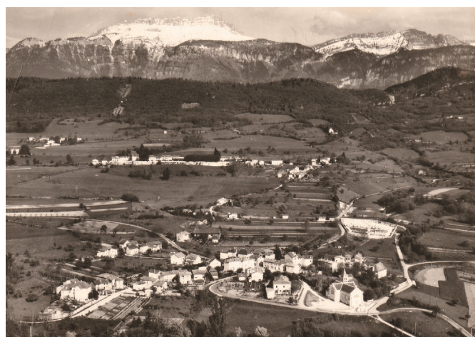
Coublevie en 1960

Coublevie, commune à caractère semi rural compte alors 2080 habitants en 1962, pour une superficie de 7,1 km 2 . L'essentiel de l'habitat se situe au « Bourg », où sont implantés église, mairie, commerces et écoles. Plusieurs hameaux sont rattachés au « Bourg », Massot, Neyroud, Tivollière,... et un habitat dispersé avec quelques belles « demeures » et châteaux, avec des origines nobles ou religieuses.