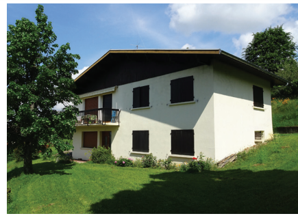
Maison de construction traditionnelle

« La branche aluminium du Groupe Pechiney possédait à Chambéry un Centre de Recherches Métallurgiques.