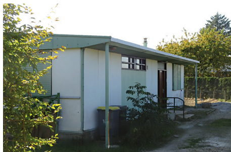
Maison en aluminium