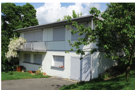
Maison construction aluminium

M. Moriceau fait partie des salariés qui sont arrivés à l'occasion de la création du CRV, il nous livre ci-après son témoignage :