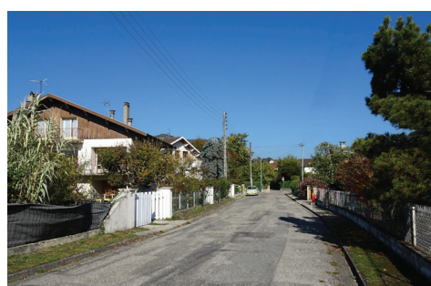
Rue des Charmilles