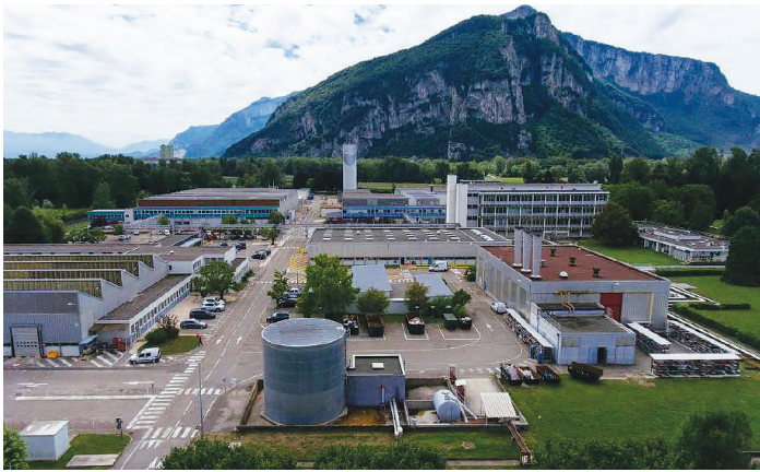
Centre de Recherche de Voreppe (CRV)

à Voreppe, où il deviendra le « Centre de Recherche de Voreppe » (CRV pour les initiés), ce qui amène la création de logements à Coublevie..