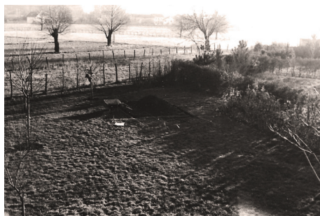
Terrain à bâtir du lotissement

Villard, et seize lots sous forme de terrains à bâtir, chaque postulant y menant son projet, ce qui fait que toutes ces maisons sont différentes, bien qu'ayant un air de famille avec celles du « Maleyssard ».